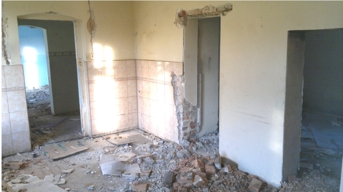
Rys. 3. Ściany nośne z cegły ceramicznej Rys. 2. Dach drewniany i ścianki działowe.

Na rys. 2 ogólny widok budynku od strony ulicy Sosnowieckiej. Widoczne uszkodzenia zewnętrznych warstw ochronnych; pokrycie tynki, stolarka okienna.