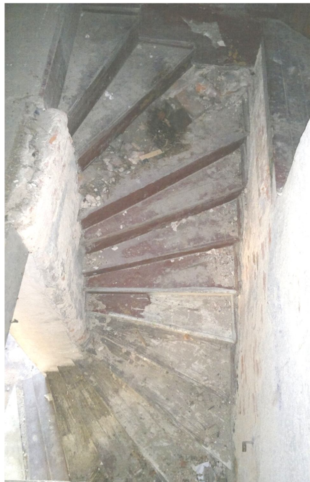
Rys. 4 Schody wachlarzowe

Na rys nr 3. Widać częściowo układ drewnianej więźby dachowej, murowane ścianki kolankowe przy nich słupki podpierające murlat, krokwie dachowe i pełne deskowanie pod pokryciem