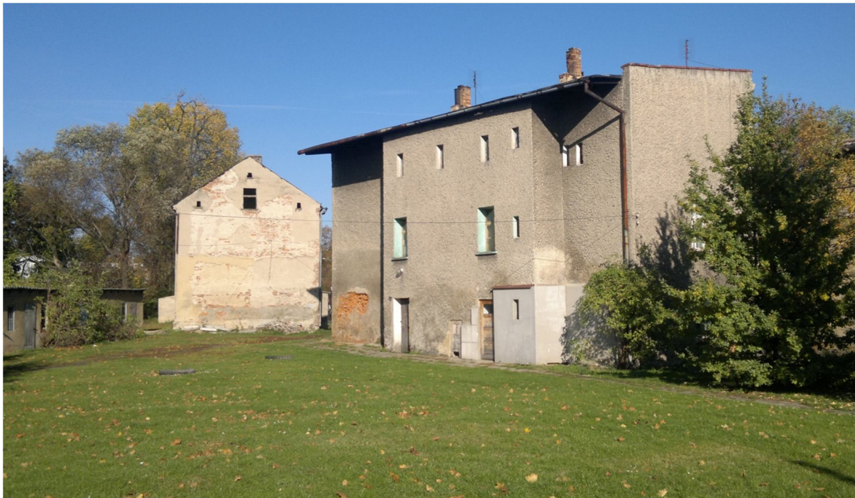
Rys. 5. Plac składowania materiałów.

Strefy gromadzenia i usuwania odpadów należy wygradzić i oznakować. Odpady należy usuwać w sposób ograniczający ich rozrzut i pylenie.