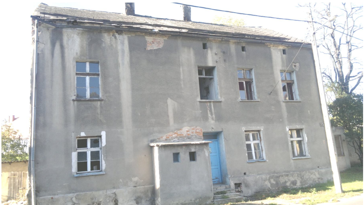
Rys. 1. Widok z drogi nr 38 (ul. Sosnowiecka). Budynek nr 6.

Budynek masywny. Fundamenty kamienne, ściany nośne z cegły ceramicznej na zaprawie cementowo-wapiennej. Ściany wewnątrz tynkowane wyprawami wapiennymi. Posadzki drewniane. Strop nad piwnicą i biegiem schodowym, to odcinkowe sklepienia ceglane. Klatka schodowa murowana ze schodami drewnianymi na sklepieniach, układ stopni wachlarzowy. Do piwnicy stopnie murowane.