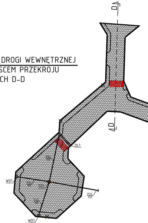
SCHEMAT PROJEKTOWANEJ DROGI WEWNĘTRZNEJ Z ZAZNACZONYM MIEJSCEM PRZEKROJU POPZRZECZNYCH D-D

Projektowanie Konstrukcji Budowlanych 48-100 Głubczyce, Gadzowice 12B tel. 609649201 e-mail: mariuszkupina@wp.pl